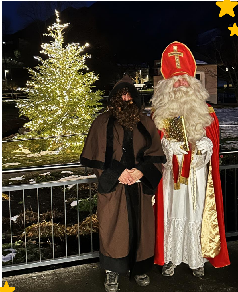
Besuch von Nikolaus und Krampus im Schlossgarten.