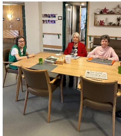
Stübli im 2. Obergeschoss