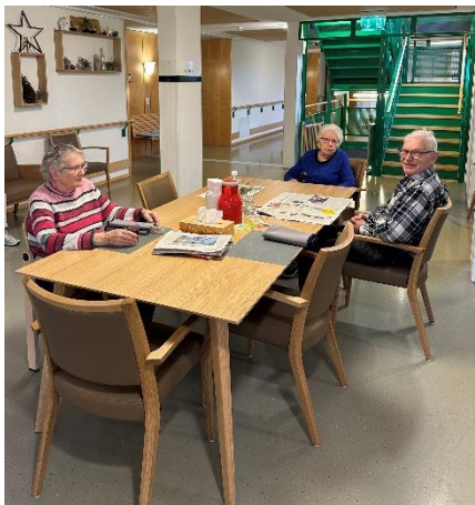
Stübli im 1. Obergeschoss

Die beiden «Stübli» im 1. und 2. Obergeschoss sind beliebte Aufenthaltsorte, sei es zum Essen, als Treffpunkt für Gespräche, zum Lesen oder einfach zum Zusammensein. Die Bewohnenden schätzen die hübschen neuen Möbel sehr.